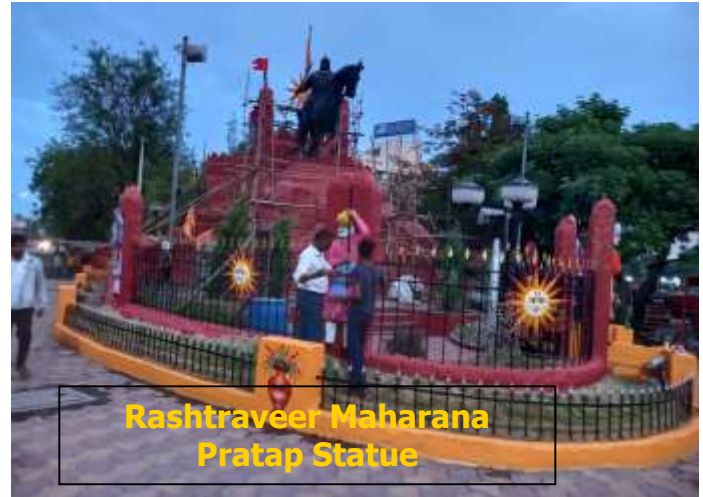
Rashtraveer Maharana Pratap Statue