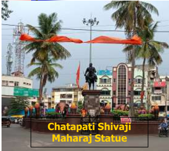
Chatapati Shivaji Maharaj Statue