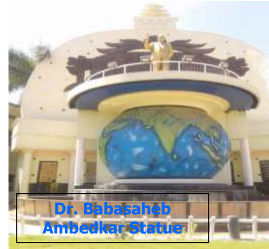
Dr. Babasaheb Ambedkar Statue