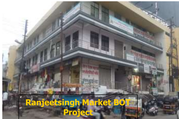
Ranjeetsingh Market BOT Project