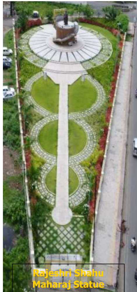
Rajeshri Shahu Maharaj Statue