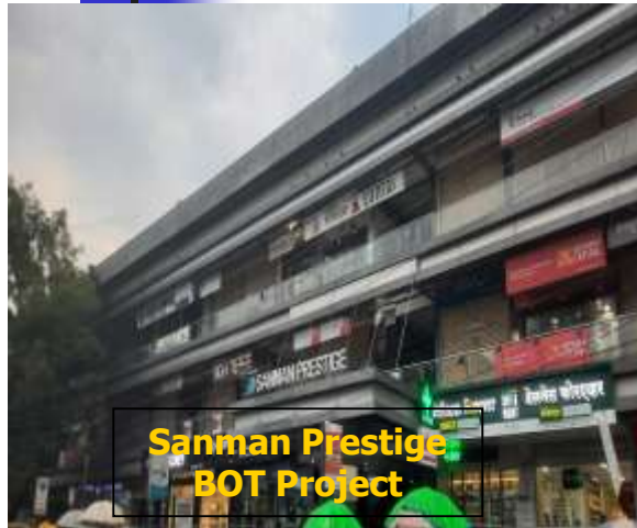
Sanman Prestige BOT Project