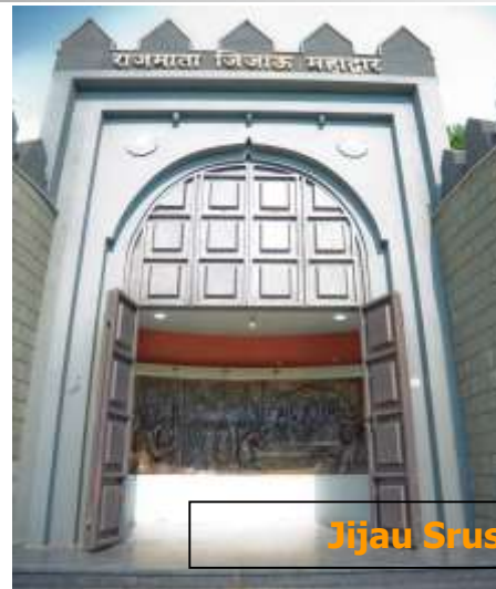
Jijau Srushti Janki ngr