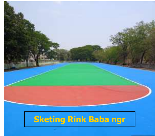
Skating Rink Baba ngr