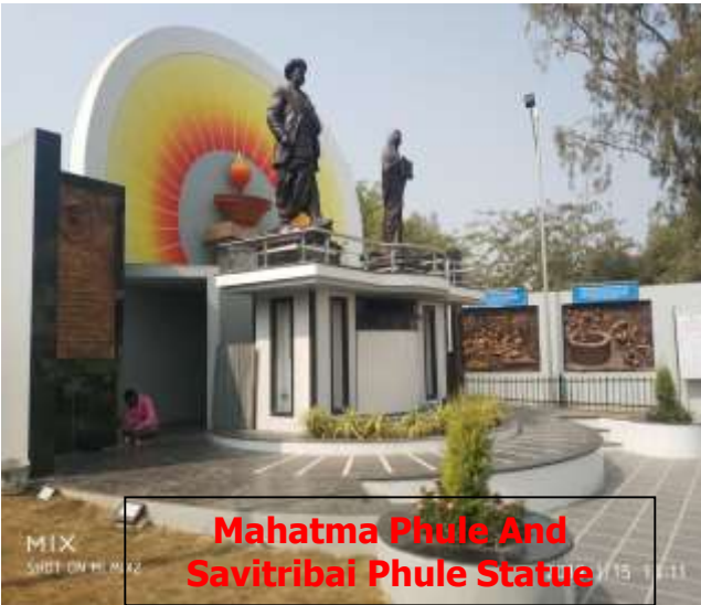
Mahatma Phule And Savitribai Phule Statue