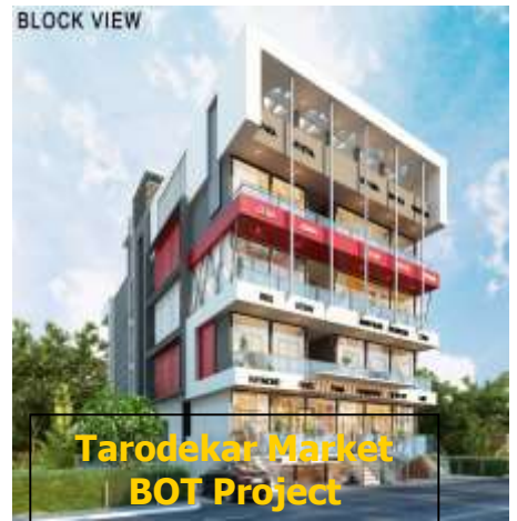
Tarodekar Market BOT Project