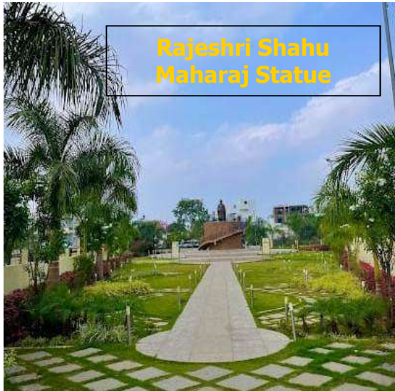
Rajeshri Shahu Maharaj Statue