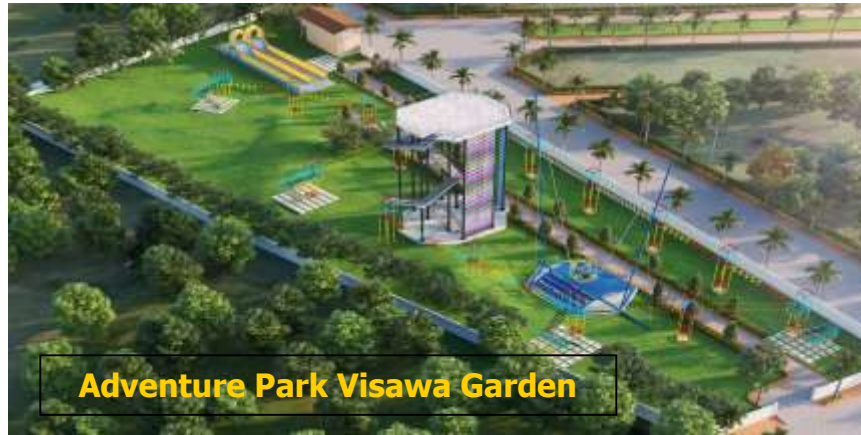
Adventure Park Visawa Garden