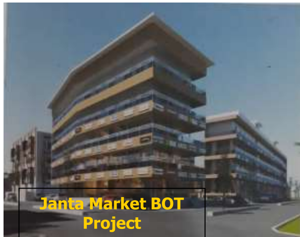
Janta Market BOT Project