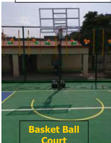
Basket Ball Court Vishnu ngr