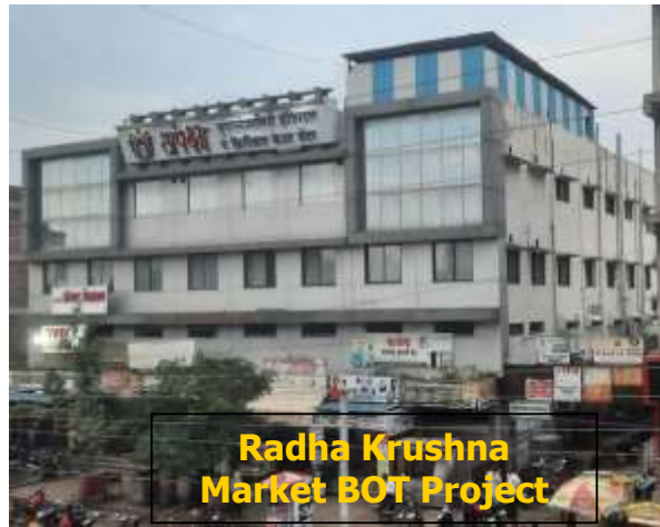
Radha Krishna Market BOT Project