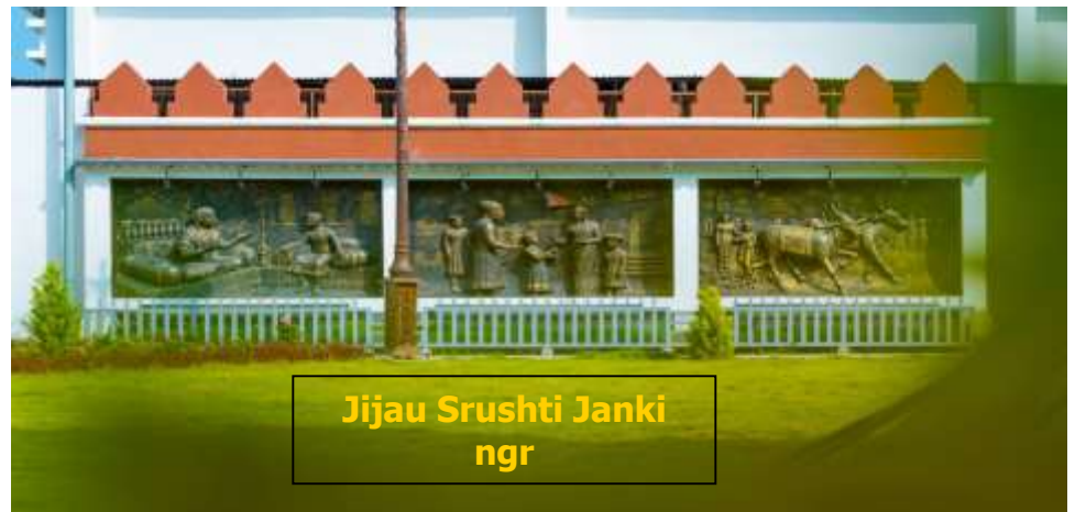
Jijau Srushti Janki ngr