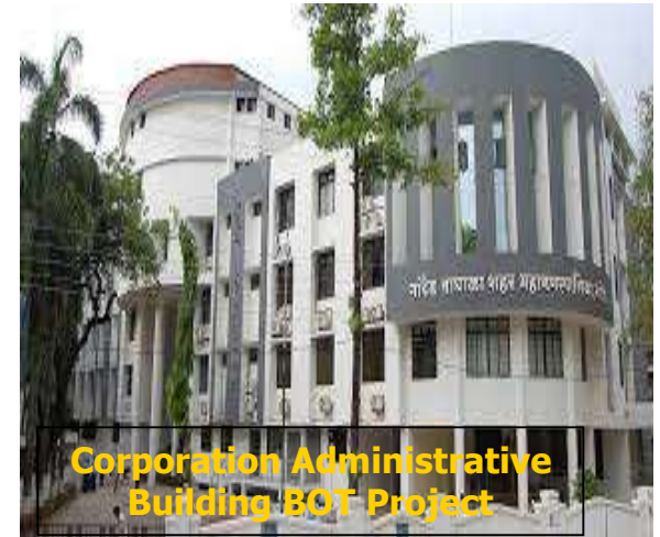
Corporation Administrative Building BOT Project