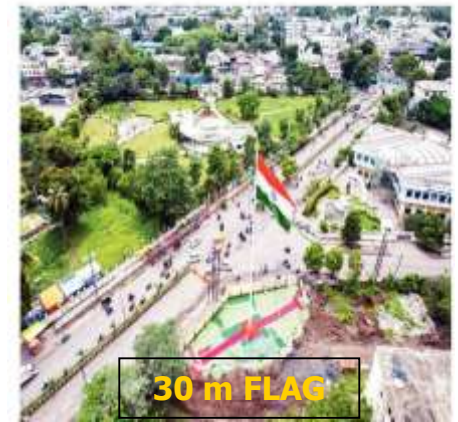
30 m FLAG