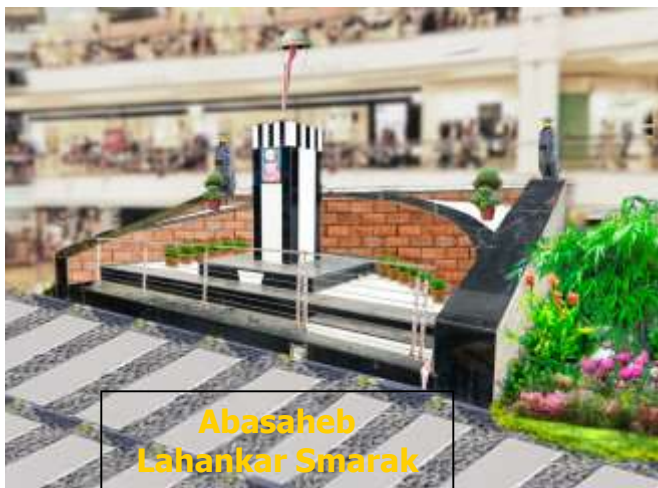
Abasaheb Lahankar Smarak