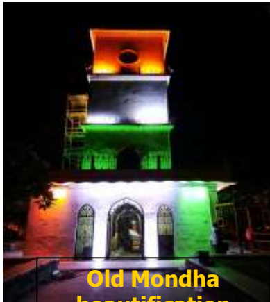
Old Mondha beautification