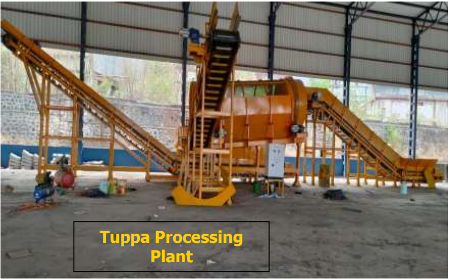
Tuppa Processing Plant