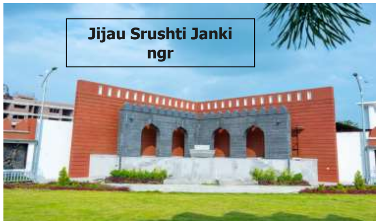
Jijau Srushti Janki ngr