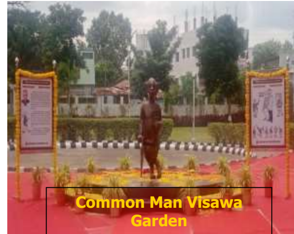
Common Man Visawa Garden