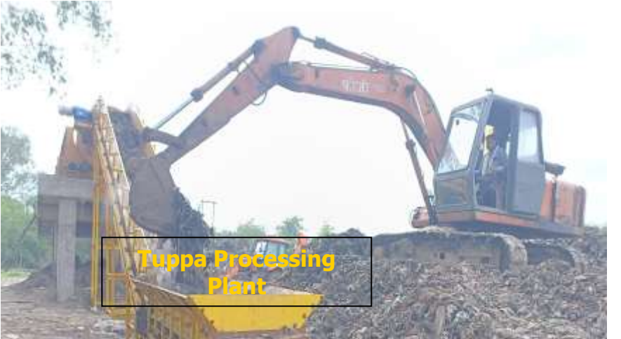
Tupa Processing Plant