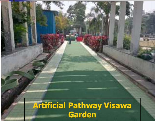
Artificial Pathway Visawa Garden