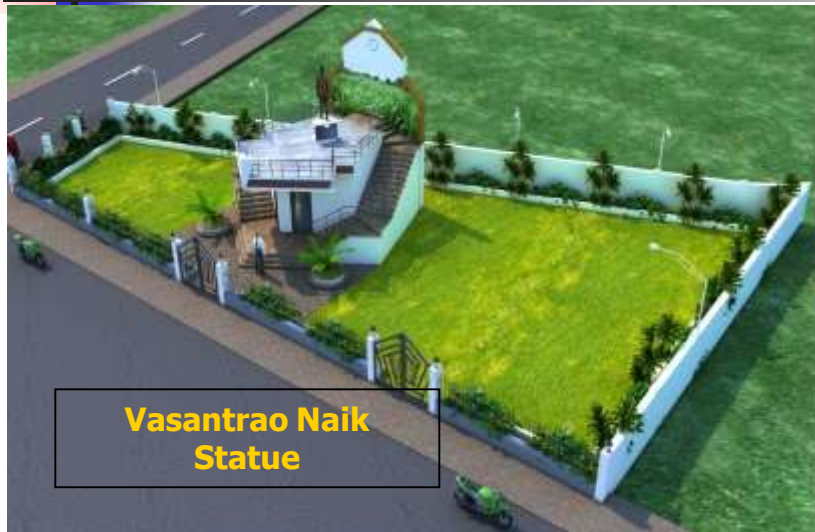
Vasantrao Naik Statue