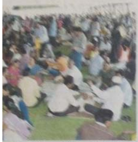
राजकीय तंत्रिकेच्या देणगीवर अधिकारी आणि